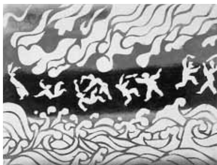
十三妹「焼打ち成功」