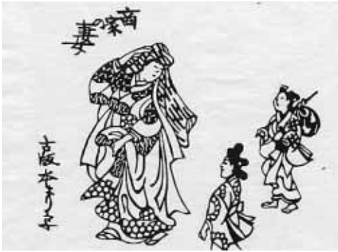
文化の反逆「商家の妻女」

芹沢銈介の物語絵の独自性と愉しさについては、本誌でも四回にわたって述べてきました。平安朝以来、絵巻物や各種の絵本の伝統のあるわが国で、芹沢銈介の作風はもともと日本的で、正統を継いだものといつてよいでしょう。