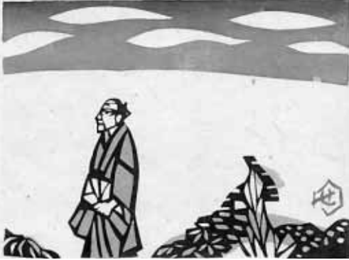
文化の反逆「稿 成りてのち」