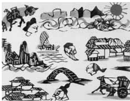
十三妹「旅の楽しみ」