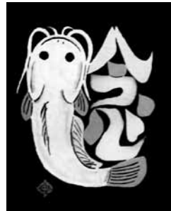
40 型絵染 鯉 (岡村吉右衛門)