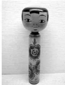
45 本多洋 尺 (土湯)