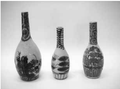
17 蛸唐草印判手一輪差3種