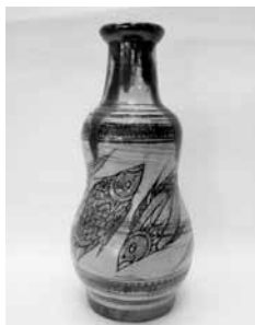
24 魚文嘉瓶 (宮城智)