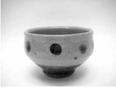
14 点文汲出 (濱田門窯)