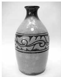
20 搔落徳利 (金城次郎)