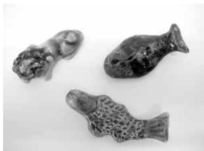
9 箸置 (金城次郎)