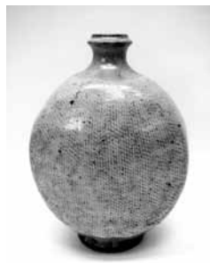
18 地釉象嵌縄文扁壺 (島岡達三)