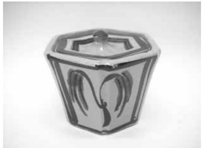
12 赤絵柳文六角蓋物 (濱田篤哉)