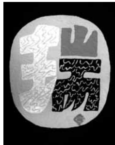
4 型絵染 瑞 (岡村吉右衛門)