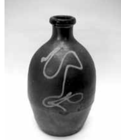
38 大徳利 (大谷)