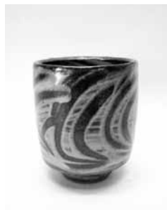
19 指描湯呑 (島岡達三)