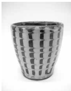
23 スリップ湯呑 (藤井佐知)