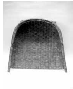
41 イタヤ箕 (東北)