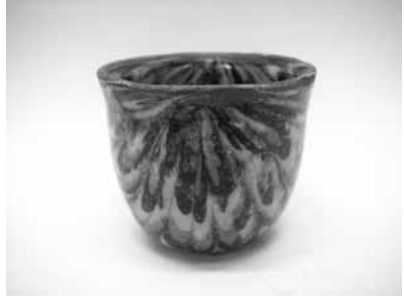
10 練上ぐい呑 (上田恒次)