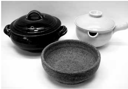
左から出西窯まんじゅう蒸し(鳥根)、石鍋(韓国)、伊賀雪平鍋(三重)

蓋の岩手県南部鉄器の飯釜や、滋賀県信楽焼の織部炊飯釜、そして鳥取県の山本教行作蓋つき片手土鍋です。いずれも熱の伝わりが均一でむらなく炊き上がり、水加減、火加減でオコゲも自在に作れます。