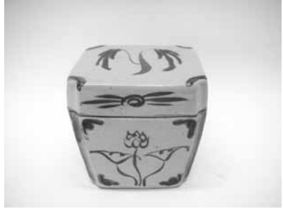
11 赤絵柳文角蓋物 (濱田篤哉)