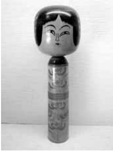
46 佐藤重之助 尺二寸 (肘折)