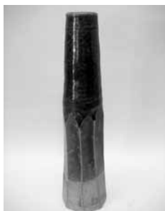
25 緑釉野花立 (瀬戸本業窯)