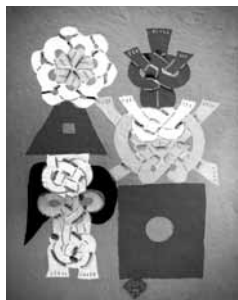
7 型絵染 福 (岡村吉右衛門)