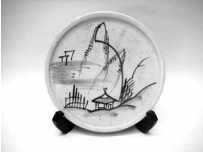
15 山水絵行灯皿 (瀬戸本業窯)