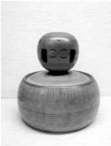
49 新山久志 えじこ (弥次郎)