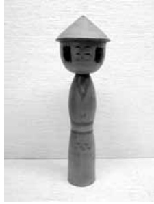
42 新山久志 八寸 (弥次郎)