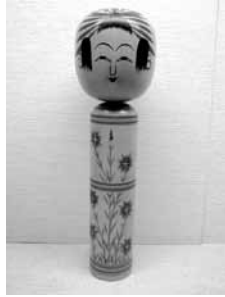
43 奥山庫治 尺三寸 (肘折)