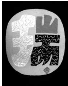
4 型絵染 瑞 (岡村吉右衛門)