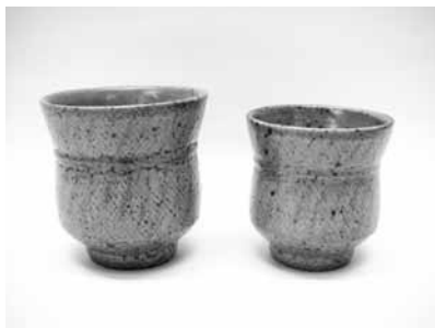
3 象嵌夫婦湯呑 (島岡達三)