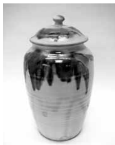
29 蓋壺 (龍門司)