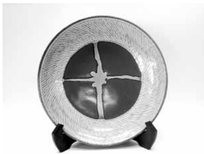
2 象嵌尺皿 (島岡達三)