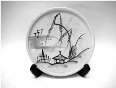
15 山水絵行灯皿 (瀬戸本業窯)