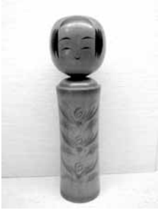
47 高橋武蔵 尺 (鳴子)