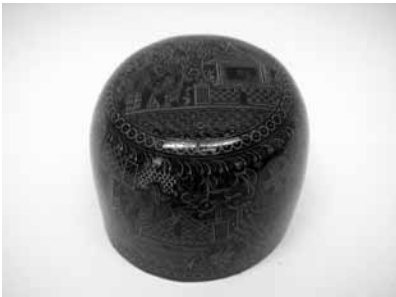
36 キンマポール(ミャンマー)