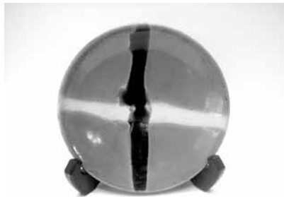
8 十文字七寸皿 (島岡達三)