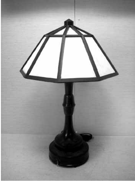
1 蛍光灯用九角スタンド(鳥取)