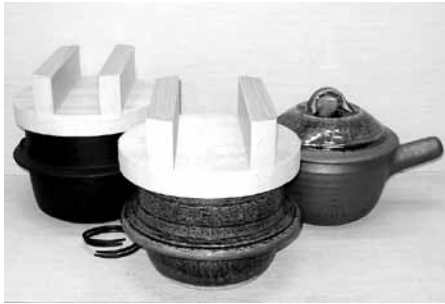
左から南部鉄器飯釜(岩手)、信楽焼織部炊飯釜(滋賀)、山本教行作蓋つき片手土鍋(鳥取)