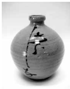
26 鉄絵徳利 (永坂)