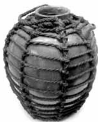
27 雲助 (苗代川)