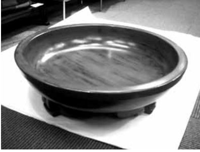
34 根来三つ足大鉢(夏目有彦)