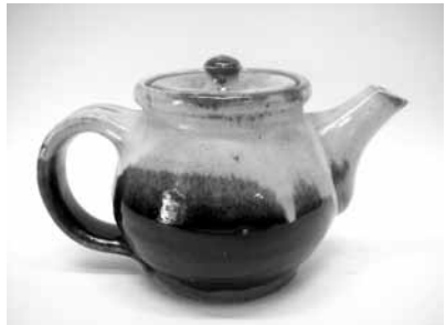
13 後手急須 (濱田門窯)