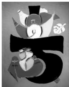
6 型絵染 寿 (岡村吉右衛門)