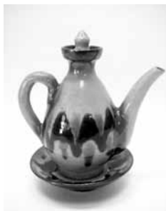
22 皿付たれ入 (金城次郎)