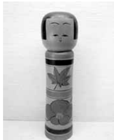
44 山谷きよ 尺 (津軽)