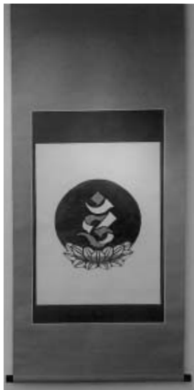
梵字 軸装 一八九、〇〇〇円