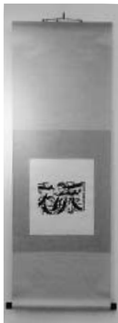
極楽から来た図 軸装 一〇五、〇〇〇円