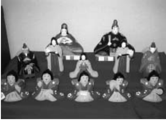
雛人形段飾り(秋田県横手中山人形)

家の屋号が「ひなや」というものであったところも多い。このようにして、雛人形は江戸時代後半から明治のはじめ頃までには、全国各地に広まったのである。