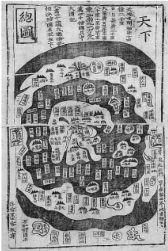
天下総図 (韓国 朝鮮王朝)