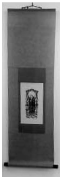
法然上人御影 軸装 一五七、五〇〇円