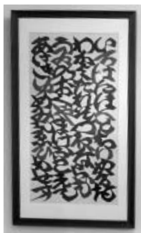
いろは模様 型染絵 二六一、五〇〇円