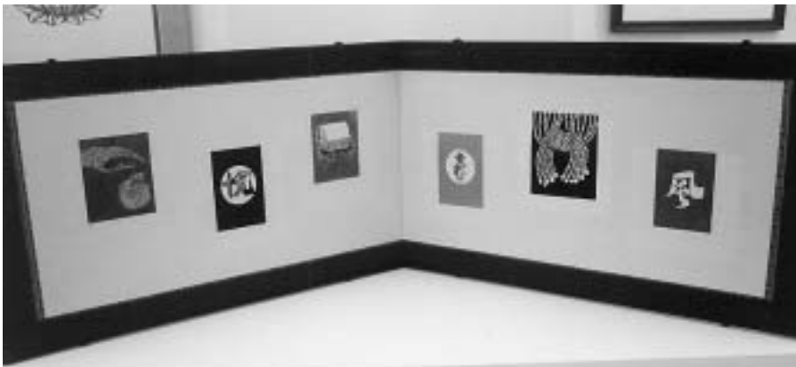
のれん雛型図屏風 504,000 円