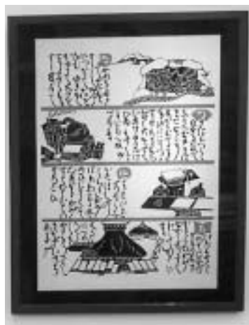
和紙譜 型染絵 六三〇、〇〇〇円