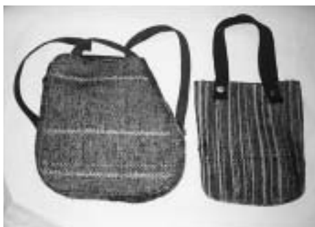
裂織のリュックサック(左)と手さげカバン